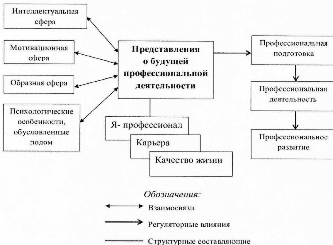
Рисунок 1 – Структурно-функциональная модель представлений учащихся колледжа о будущей профессиональной деятельности

месте в обществе и в профессиональной среде, которые обеспечит будущая профессиональная деятельность; подсистема «Качество жизни» характеризует представления о материальных и социальных последствиях сделанного профессионального выбора и включает представления о материальном достатке в профессии, представления об уровне и качестве жизни, которые обеспечивает будущая профессиональная деятельность.